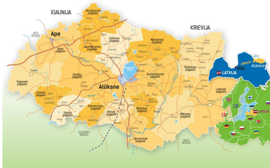
1.attēls, Alūksnes lauku partnerības darbības teritorijas karte, 2020