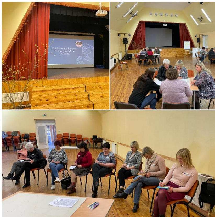
Diskusiju aplī norisinājās starpteritoriālā sadarbības projekta Nr.19-00-A019.332-000006 "Bānīša zemes labumi - 33 km garumā un platumā!" ietvaros.