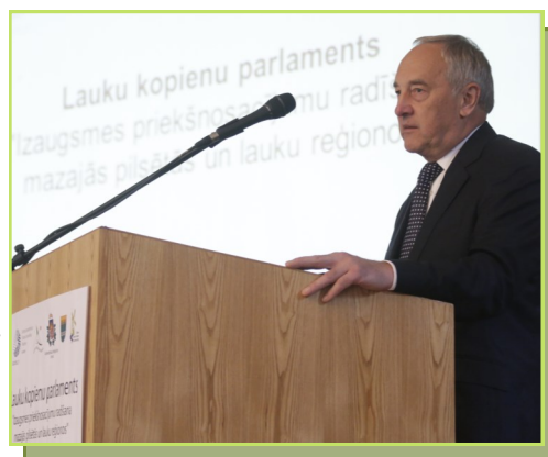
2.Latvijas Lauku kopienu parlamentu atklājot, Latvijas valsts prezidents Andris Bērziņš Līgatnes kultūras namā, 03.06.2015.